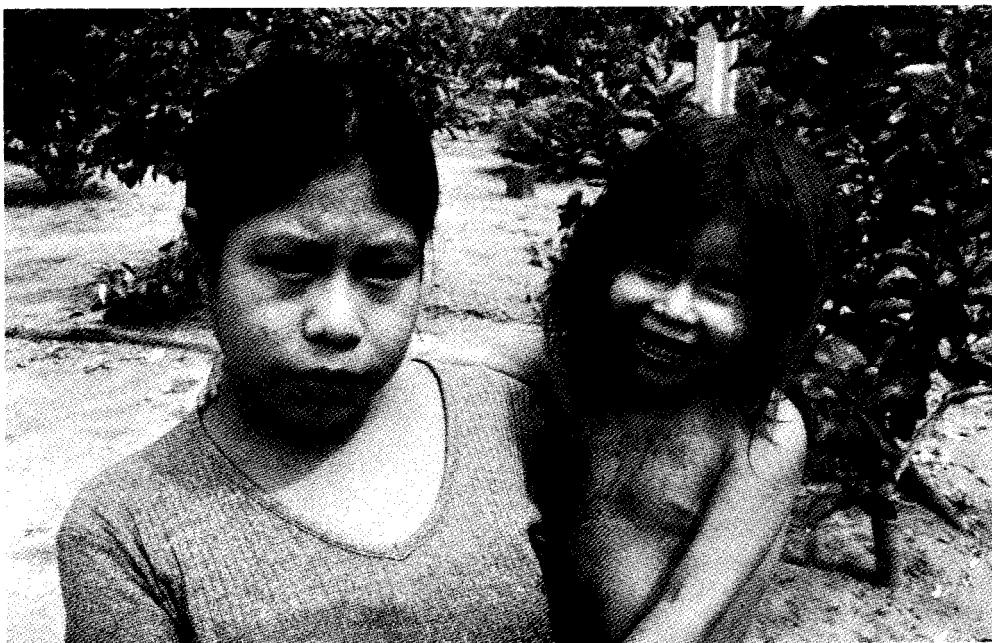
Indianermor og datter i en Ache-koloni

På daghjemmet i Pedro Juan Caballero er det bygd to klasserom på skolen og en bestyrerbolig. Det integrerte skole- og organisasjonsutviklingsprosjektet kunne i 2009 ferdigstille skolebyggingen i flere indianerkolonier, og studentene som har mottatt støtte gjennom prosjektet har fullført sine utdannelser. Dette arbeidet er nå avsluttet og ledelsen i hver indianerkoloni står ansvarlig for skoledriften. Evalueringer har konkludert med at skolene fungerer bra.