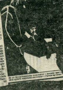
De av Santalmisjonens misjonærer i siste del av år er vurdert misjonsaktiviteter i Curaca og Olan til Vårt Land.