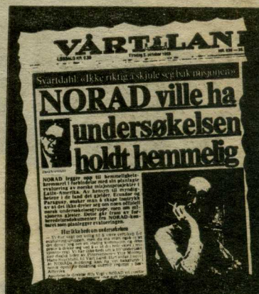
Vårt Lands oppslag igår.

—Det er strutsepolitikk av misjonen ikke å akseptere at deres prosjekter blir gjenstand for en evaluering. Misjonen bør åpne opp og ikke dekke til. Den kan ikke stå fram som noen hellig ku, beskyttet mot ethvert innsyn. Så lenge misjonen har tro på det de står for, har de ingenting å være redd for i en slik evalueringssam-