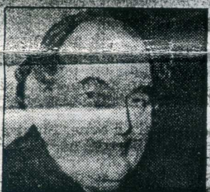
Mogens Glistrup dømt for skattesvik