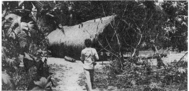
Typisk indianerhytte inne i skogen.