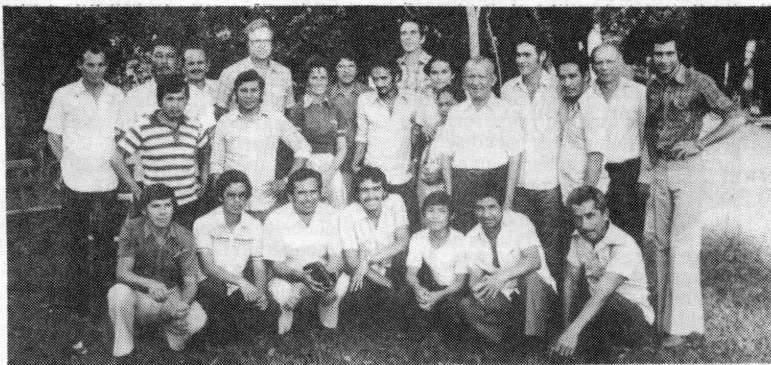
Fra en årskonferanse